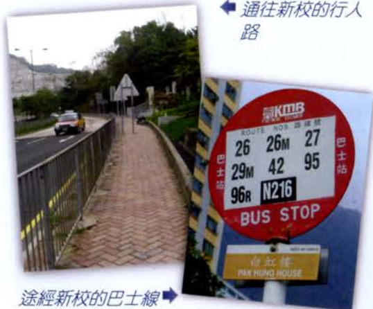
途經新校的巴士線

雖然新校位處新發展區內，但因鄰近彩虹各屋村，社區設施相當完善，附近的坪石遊樂場提供了不少運動場地，如網球場、足球場等。而對面的彩雲商場有多間快餐店及茶餐廳，為同學提供多元化的選擇。