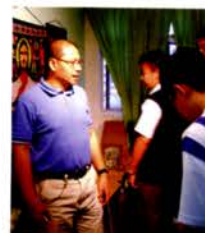
記者們對祈禱室的一切皆感到好奇。