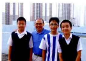
小記者們與神父於天台留影。