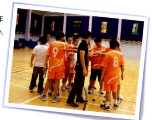
手球隊的團結，是他們取得優異成績的關鍵。

雖然手球隊於今年學界比賽中，取得令人滿意的成績，但相信他們都不會因此而自滿，反而會把今天的成功當作一個寶貴的經驗，繼續奮鬥，爭取更佳成績。