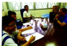
記者們和神父有說有笑。

通往天台的唯一通道就設在「學生禁地」的神父宿舍內。由於那裡地面凹凸不平，也沒有足夠的保護設施，故校方一直沒有開放天台予同學進入。